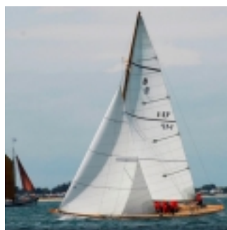
Aria (clicca per ingrandire)