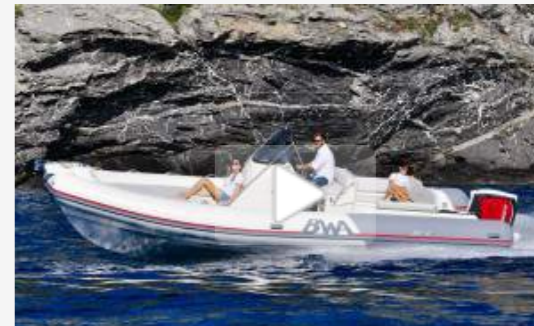
BWA Sport 28 GT