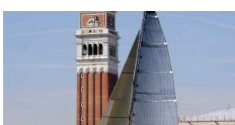
Padova e Venezia, il rilancio della nautica passa dal Veneto