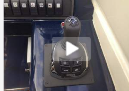
Volvo Penta lancia il joystick per le trasmissioni in linea d'asse