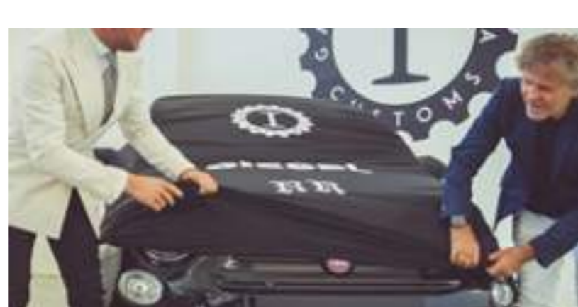
Ecco la nuova Fiat 555RR!