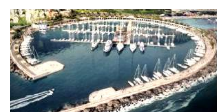
Porto Ventimiglia ceduto ai monegaschi