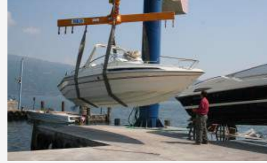
Le cure invernali per la barca