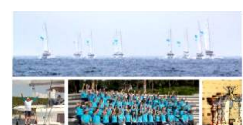
Escapade Lagoon con il dealer 4venti