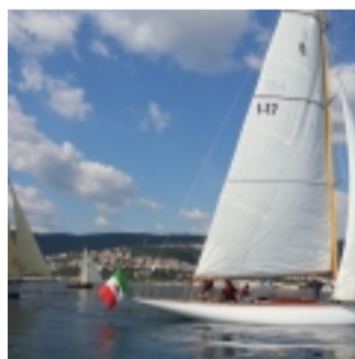
ARIA, 8 m Stazza Internazionale (clicca per ingrandire)