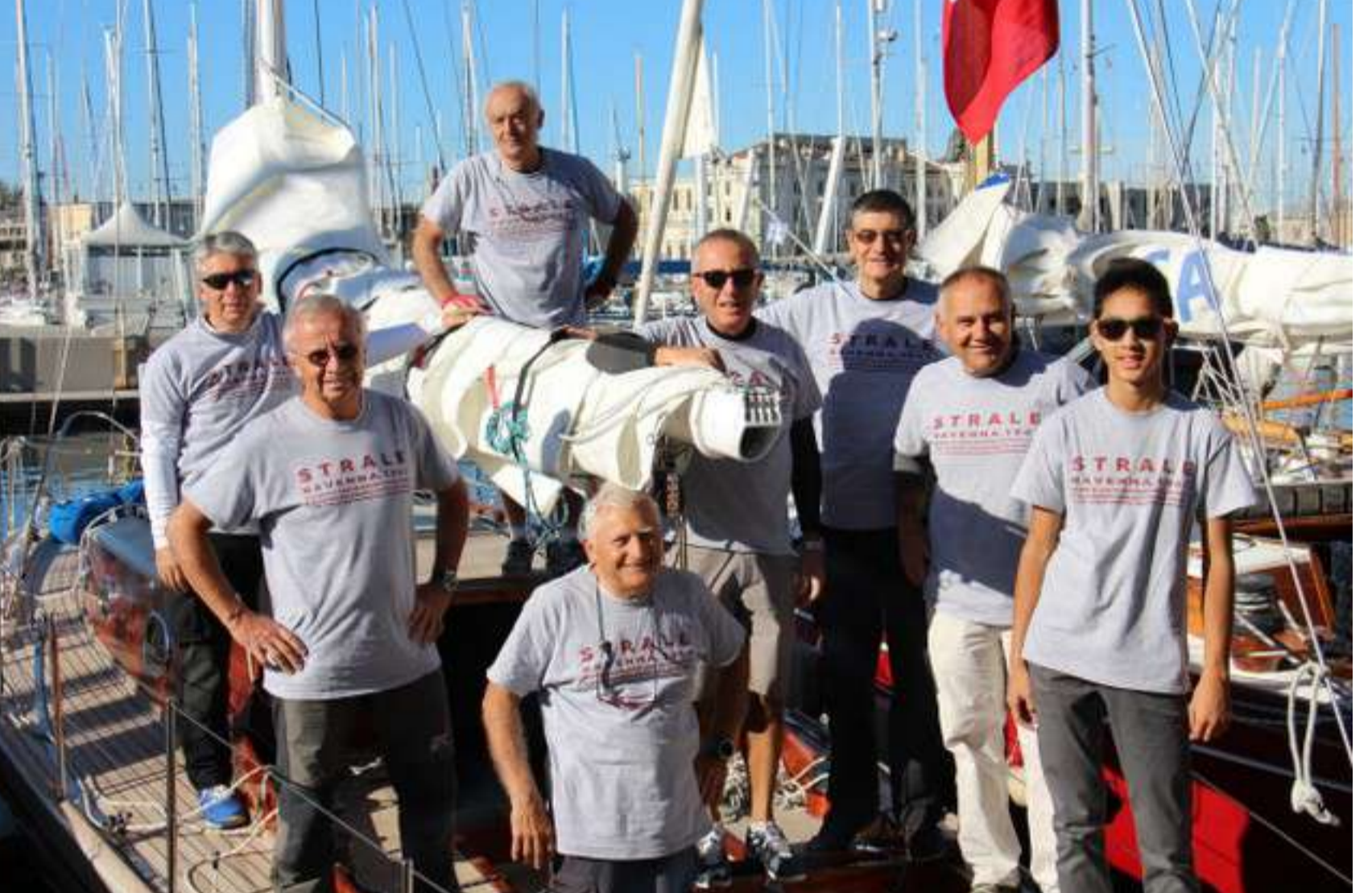
L'equipaggio di Strale