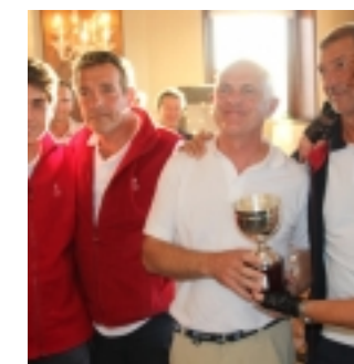
equipaggio Aria - Barcolana Classic 2017 (clicca per ingrandire)