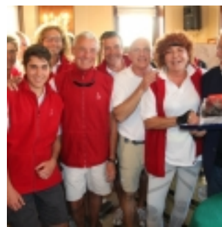
equipaggio Aria - Barcolana Classic 2017 (clicca per ingrandire) - foto Paolo Maccione