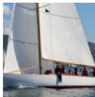
Aria - Barcolana Classic 2017 (clicca per ingrandire) - foto Paolo Maccione