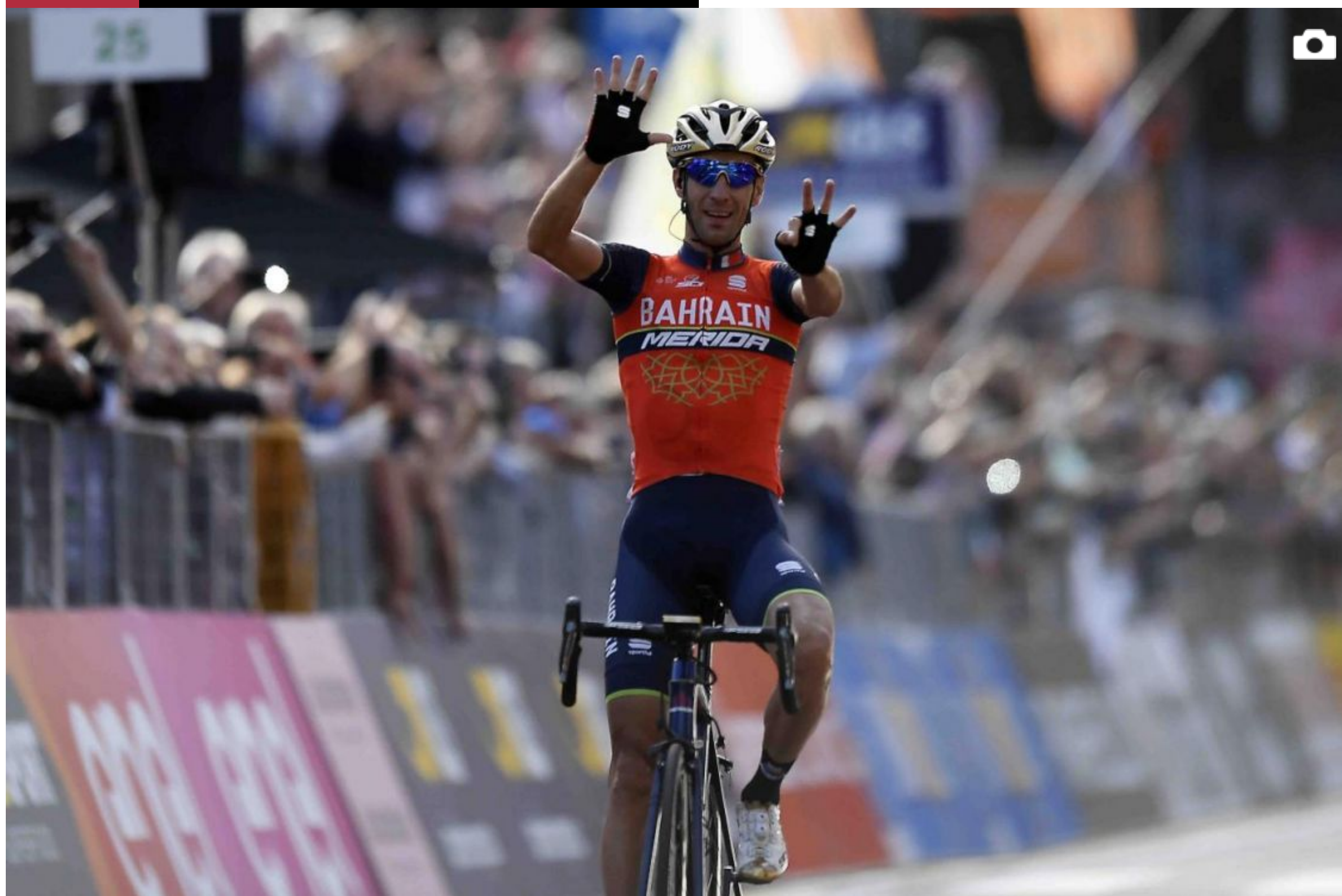
Il Lombardia - Immenso Nibali: il siciliano vince la Classica delle foglie morte [GALLERY]